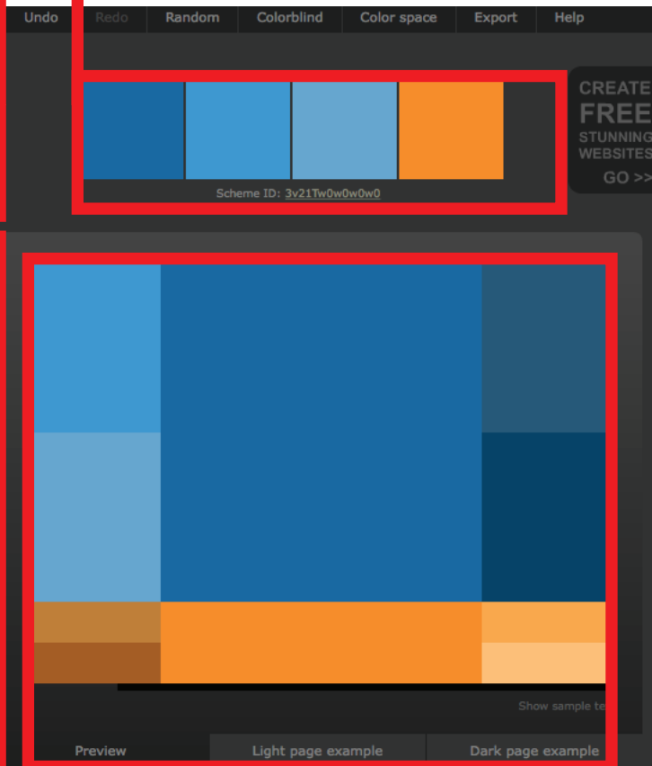
Combinación de colores